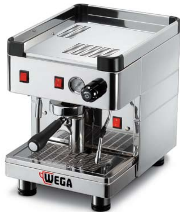
Modello MININOVA STANDARD versione EPU