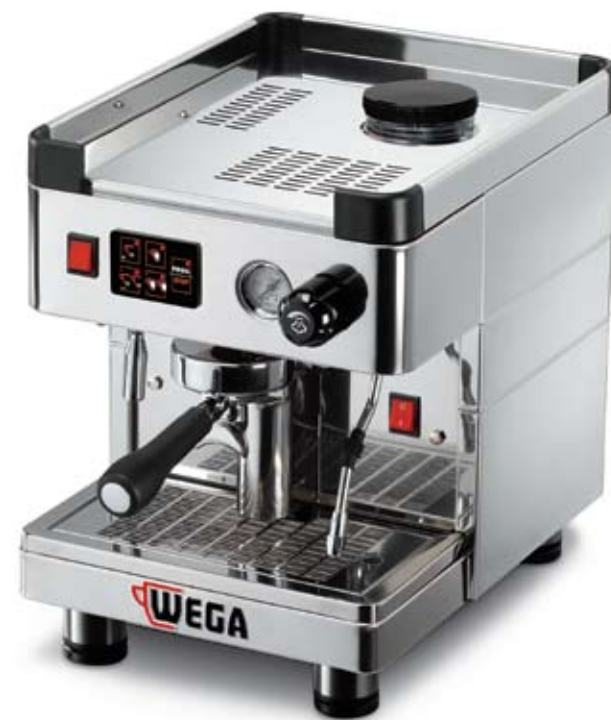
Modello MININOVA STANDARD versione EVD