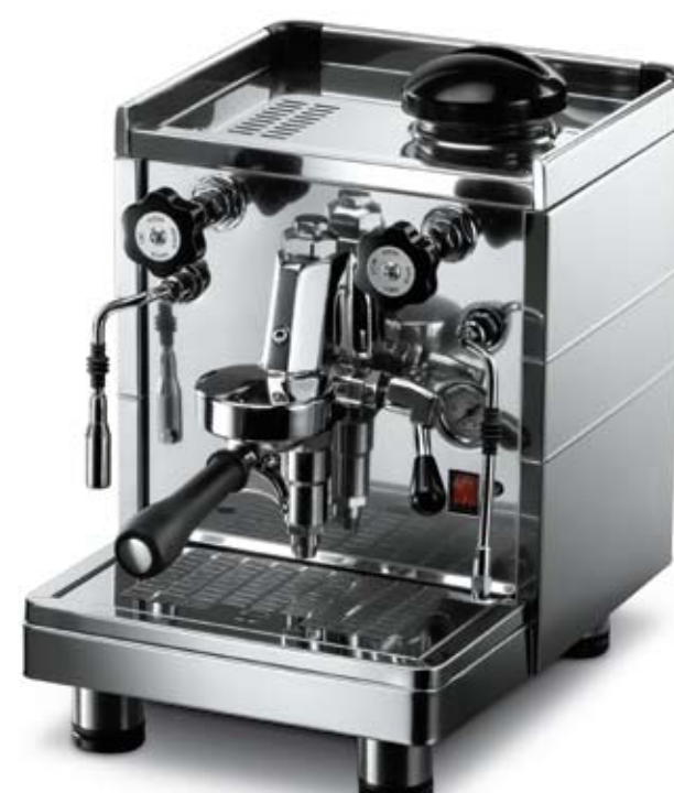
Modello MININOVA CLASSIC versione EMA